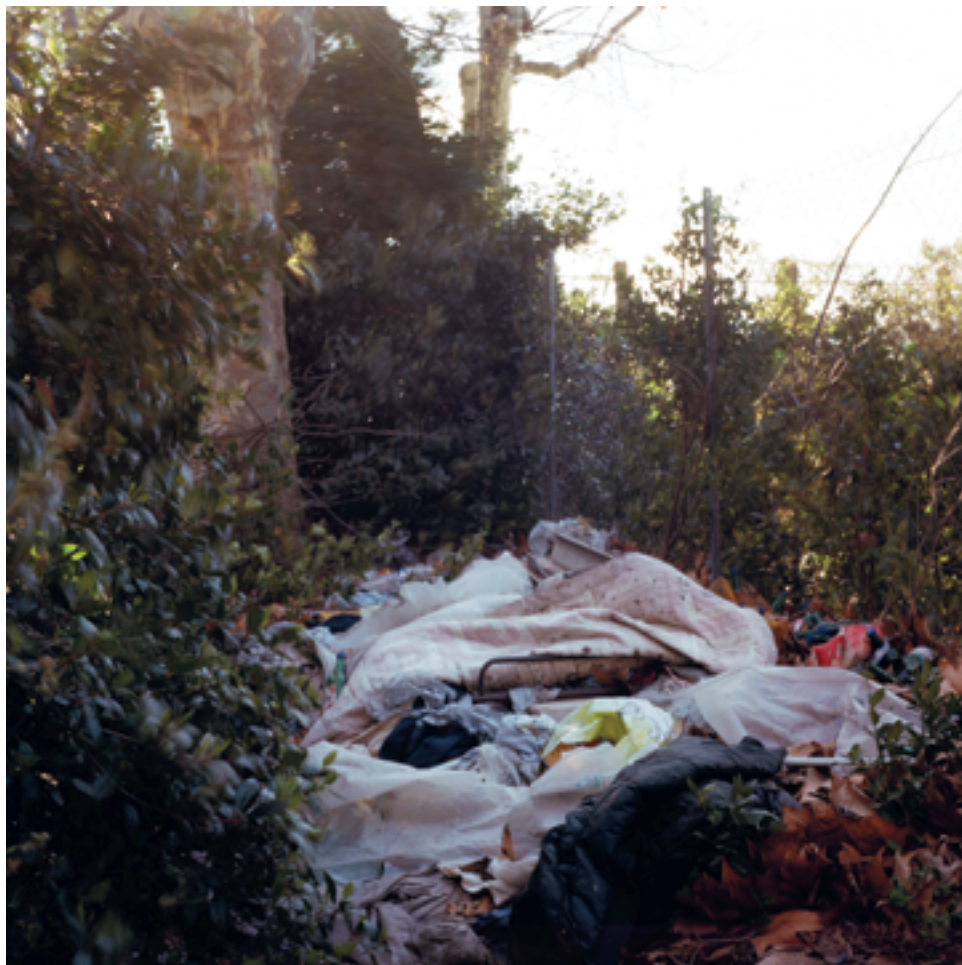
Terres communes, Marseille, 2012.