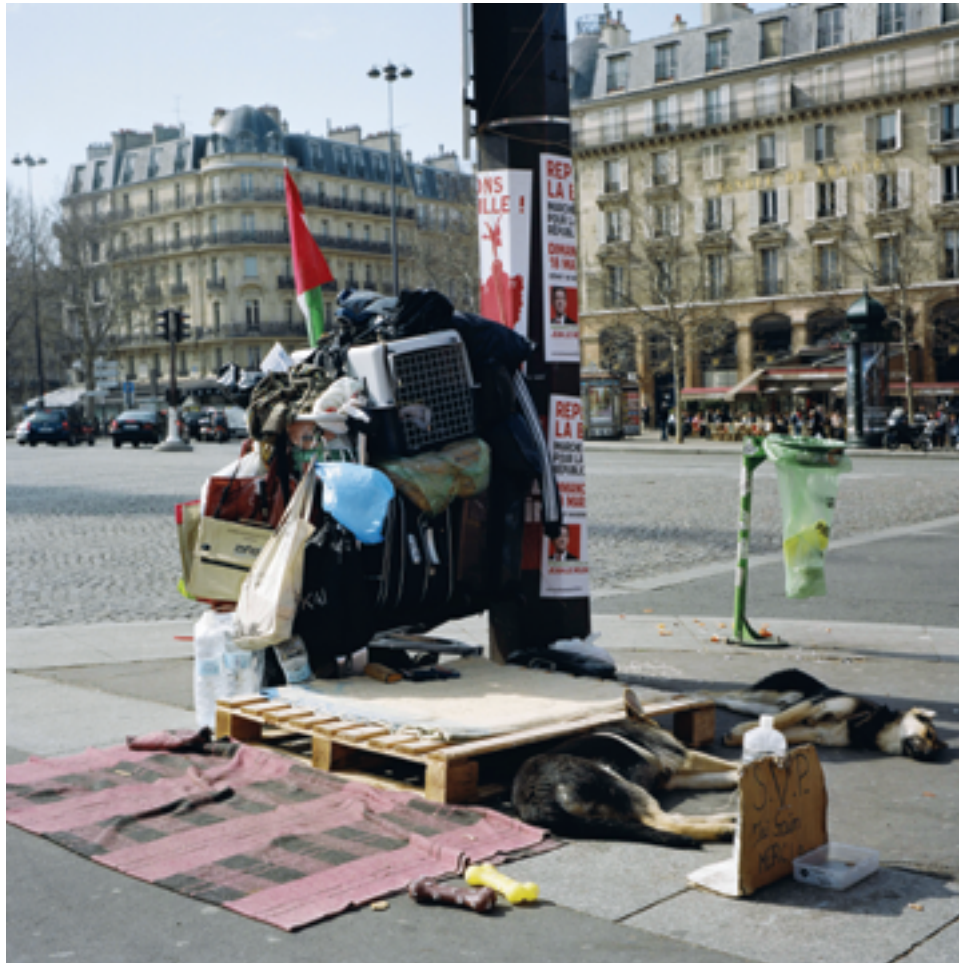
Terres communes , Paris, 2012.