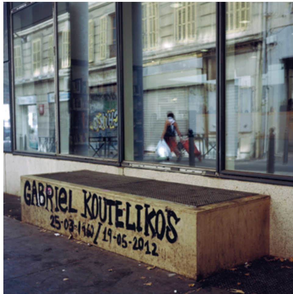
Terres communes, Marseille, 2012.