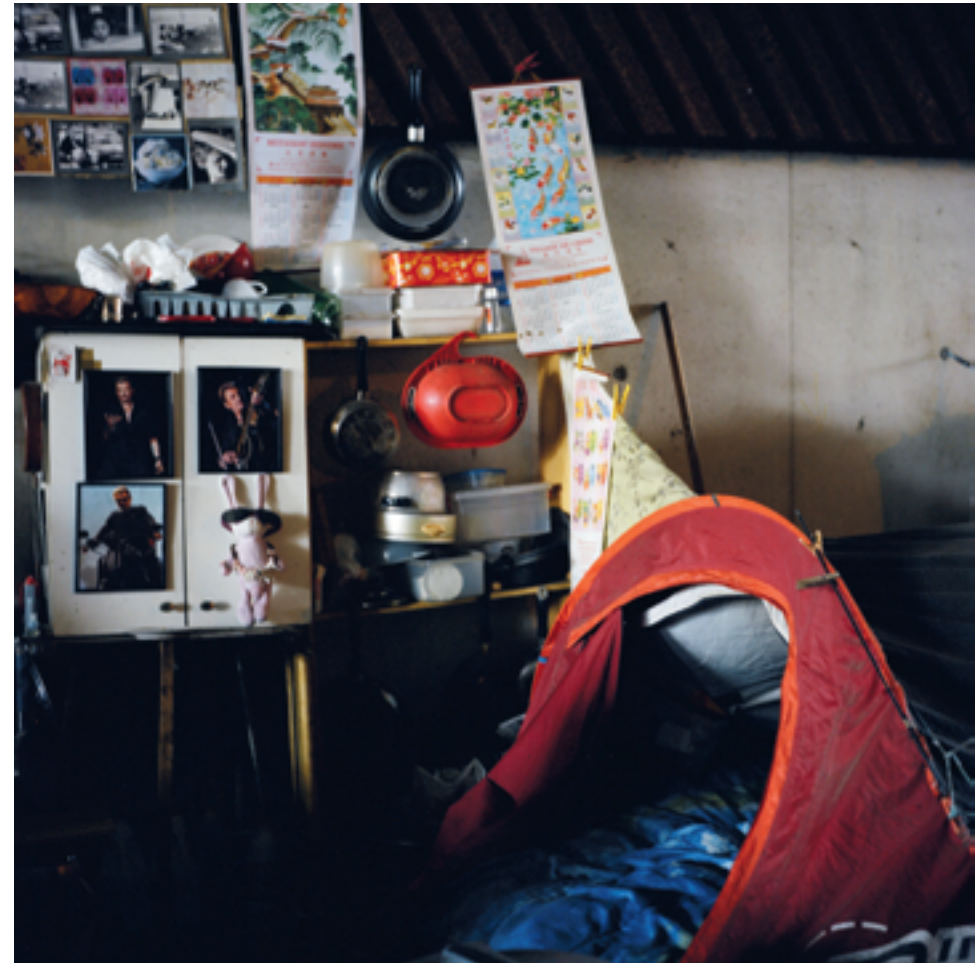
Terres communes , Paris, 2011.