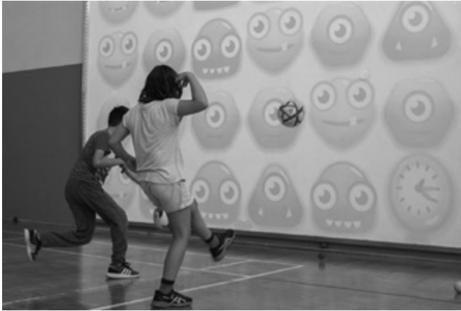
Figure 1. MultiBALL Movement Wall

Des jeux de ce type combinent des objectifs pédagogiques qui relèvent de l'éducation physique et des mathématiques. Il s'agit alors, par exemple, de toucher avec une balle la cible qui représente le résultat d'une opération.